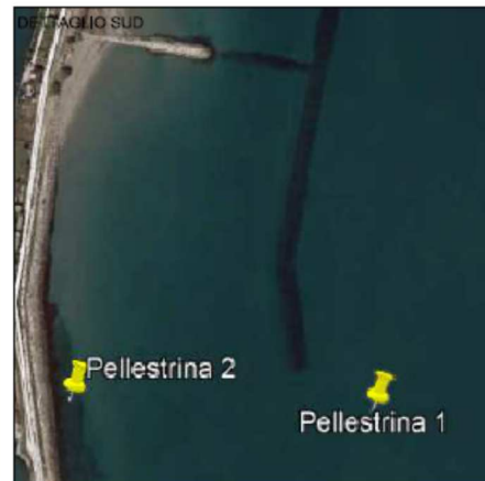
COORDINATE DEL PERIMETRO DI INTERVENTO